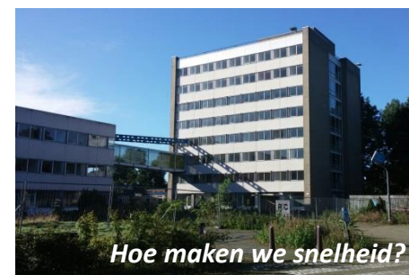
Hoe maken we snelheid?

Wat kan je zelf doen? Wat heb je daarvoor nodig? Hoe realiseer je dat?