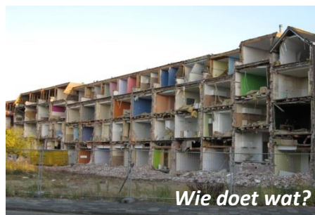
Wie doet wat?

Welke panden zijn geschikt om te transformeren naar woningen? En van wie zijn ze?