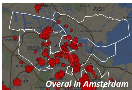
Overal in Amsterdam