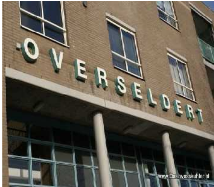
Ouderen centrum Overseldert stelt haar recreatieruimte ter beschikking

Alle geïnterviewde roostergroepen geven aan graag terug te willen komen op het moment dat 't Middelpunt weer open gaat onder een nieuwe huurder. Als tijdelijke oplossing kan gekozen worden voor een overgang naar wijkcentrum De Trefhorst die ruimte heeft voor grote activiteitengroepen.