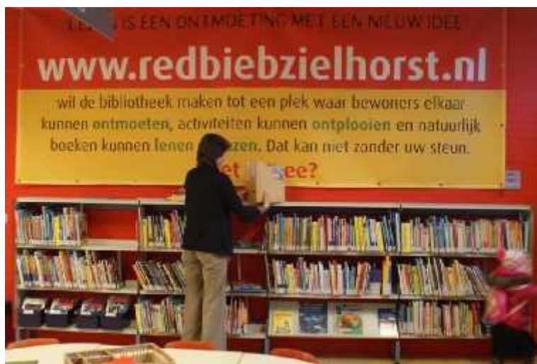
Medewerkers van bieb Zielhorst steunen de actie van RDBZ

De gemeente heeft de kaders aangegeven voor dit onderzoek 31 : belangstellenden hebben tot 1 maart 2012 de tijd om te opteren voor een nieuwe sociale bestemming van wijkcentrum 't Middelpunt, gevolgd door het doen van een haalbaarheidsonderzoek en het maken van een businessplan, waarvoor de gemeente initiatiefnemers 6 maanden de tijd geeft. De gemeente bekijkt vervolgens welke plannen het best aansluiten bij de uitvoering van het welzijnsbeleid 'nieuwe stijl', dat de gemeente de komende jaren uitzet. 32 Duidelijk is dat de gemeente de voorkeur geeft aan initiatiefnemers die een uitdrukkelijk sociale functie willen geven aan de te sluiten wijkcentra. Zijn hun plannen niet te realiseren, dan komen potentiële commerciële kopers aan bod. De gemeente heeft -nog- niet aangegeven of bovenstaande aanpak en termijnen ook gelden voor het pand van de bibliotheek aan de Albert Schweitzersingel in Zielhorst. Wél heeft de gemeente – eerst informeel en later formeel - te kennen gegeven voorkeur te hebben voor de verkoop van het bieb pand.