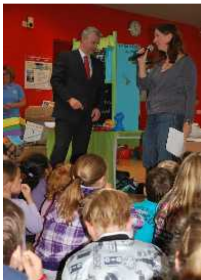
Manifestatie 5 oktober 2011 in Bieb Zielhorst

Deze actie werd gehouden onder de naam "Red de Bieb". Het verzamelen van handtekeningen bleek niet moeilijk: meer dan 2000 bewoners waren bereid hun ongenoegen over de sluiting van de bieb en het wijkcentrum kenbaar te maken. De handtekeningen werden op woensdag 5 oktober 2011 aan wethouder Buitelaar van financiën (tevens wijkwethouder van Zielhorst) overhandigd tijdens een drukbezochte manifestatie in de bieb, waar leerlingen en leerkrachten van zes basisscholen uit Zielhorst en Schothorst aanwezig waren.