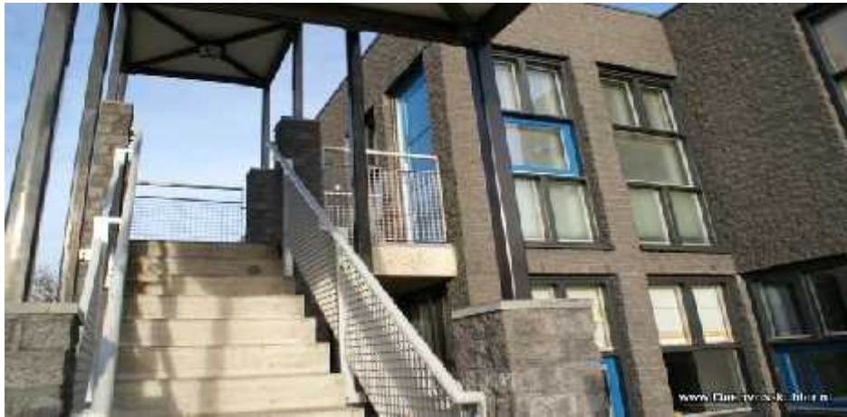
Tienercentrum ‘So What’ torent boven wijkcentrum ‘t Middelpunt uit

rechtvaardigt – althans statistisch - het bestaan van tienercentrum ‘So What’, dat als zelfstandige unit is aangehaakt bij wijkcentrum ‘t Middelpunt.