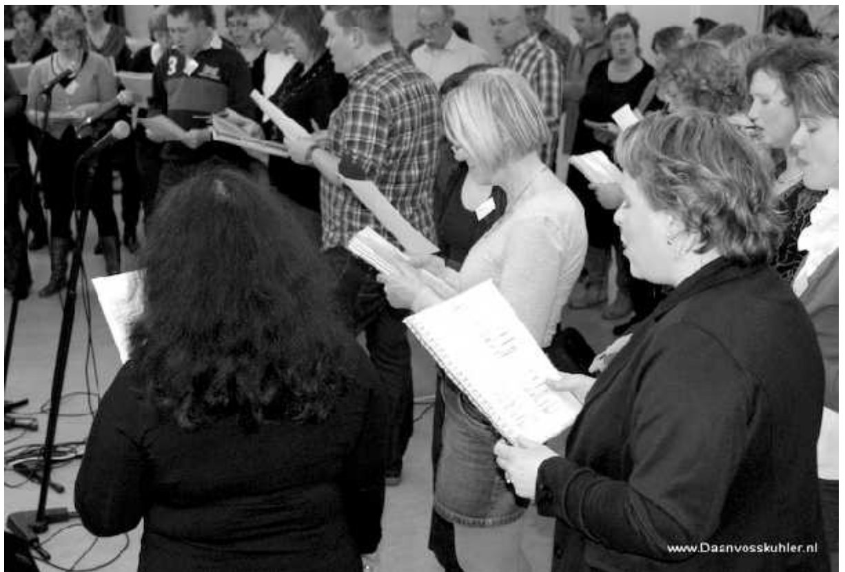
Popkoor De Pebbles in actie in 't Middelpunt

■ http://www.pzc.nl/regio/walcheren/10512790/Zorgen-om-vrijwilligers-wijkcentra.ece : gebruikers van wijkcentra maken zich zorgen over het voortbestaan van hun voorzieningen: een voorbeeld uit Zeeland