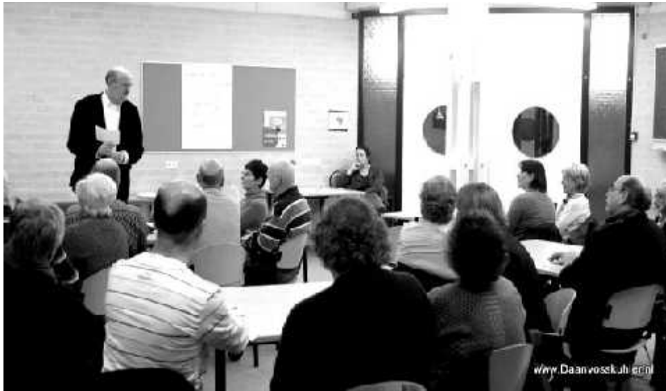
SWA inventarisatie van de wensen van vaste bezoekers van 't Middelpunt

De SWA doet in opdracht van de gemeente een haalbaarheidsonderzoek naar vervangende ruimte voor bezoekersgroepen van categorie A en B. In één bijeenkomst zijn alle gebruikers geïnformeerd over mogelijkheden voor een passende alternatieve ruimte. Externe huurders van categorie C en D hebben een schrijven ontvangen met de mededeling dat zij vanaf 1 juli 2012 geen ruimte meer kunnen huren in het betreffende wijkcentrum.