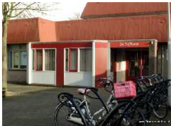
Wijkcentrum de Trefhorst: 24.000 drempeloverschrijdingen per jaar

Schothorst is goed bedeed met voorzieningen. Aan de rand van de wijk ligt NS station Schothorst, dat een snelle verbinding met ondermeer de Randstad garandeert. Winkelcentrum Schothorst kent twee supermarkten en levert een ruim basispakket aan middenstandsdiensten voor de wijkbewoners, waaronder Blokker, Zeeman, kapper, groenteman, kaasboer, slijter, café en opticiens. Pal achter het winkelcentrum ligt wijkcentrum de Trefhorst, dat zo'n 24.000 bezoekers per jaar trekt in termen van dagelijkse drempeloverschrijdingen.