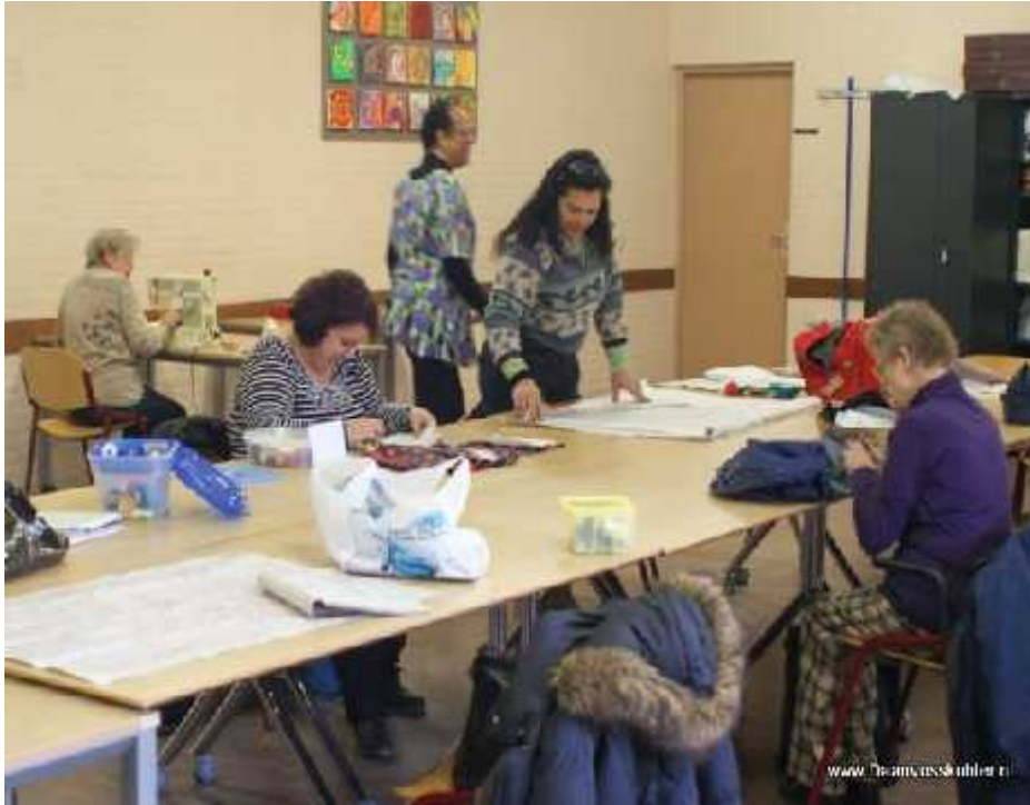
Wijkcentrum de Trefhorst: Naaicursus