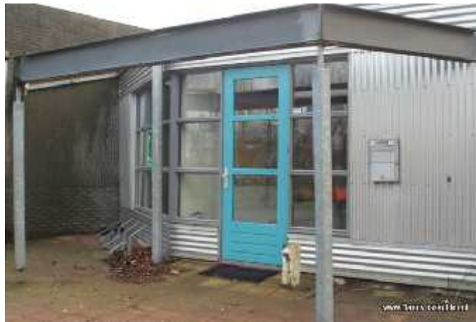
Voormalig wijkcentrum het Katshuis wacht op een koper en wordt er niet mooier op.

Eerder zagen we al dat 't Middelpunt na sluiting van het Katshuis zo'n 70% van alle bezoekers heeft overgenomen. Twee kleine creativiteitsgroepen van ouderen zijn niet meegegaan, maar zijn opgeheven. Een aantal grote bezoekersgroepen heeft elders ruimte gevonden.