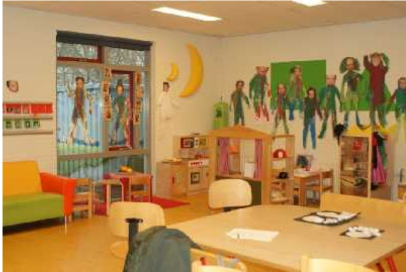
Gaat de modern ingerichte peuterspeelzaal van De Trefhorst ook verdwijnen?