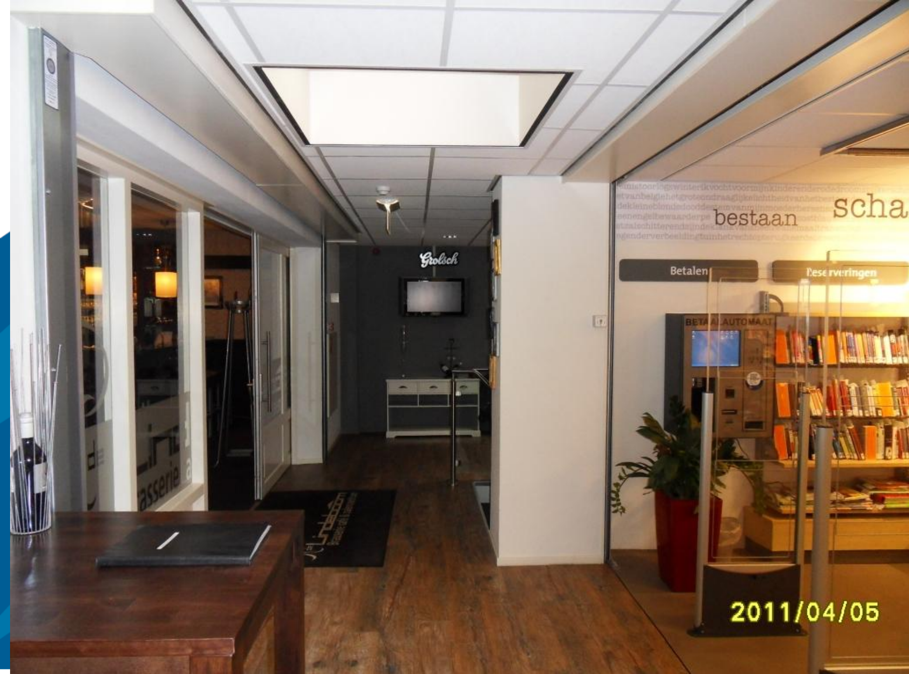
"Slimmer met vastgoed" 7 april 2011