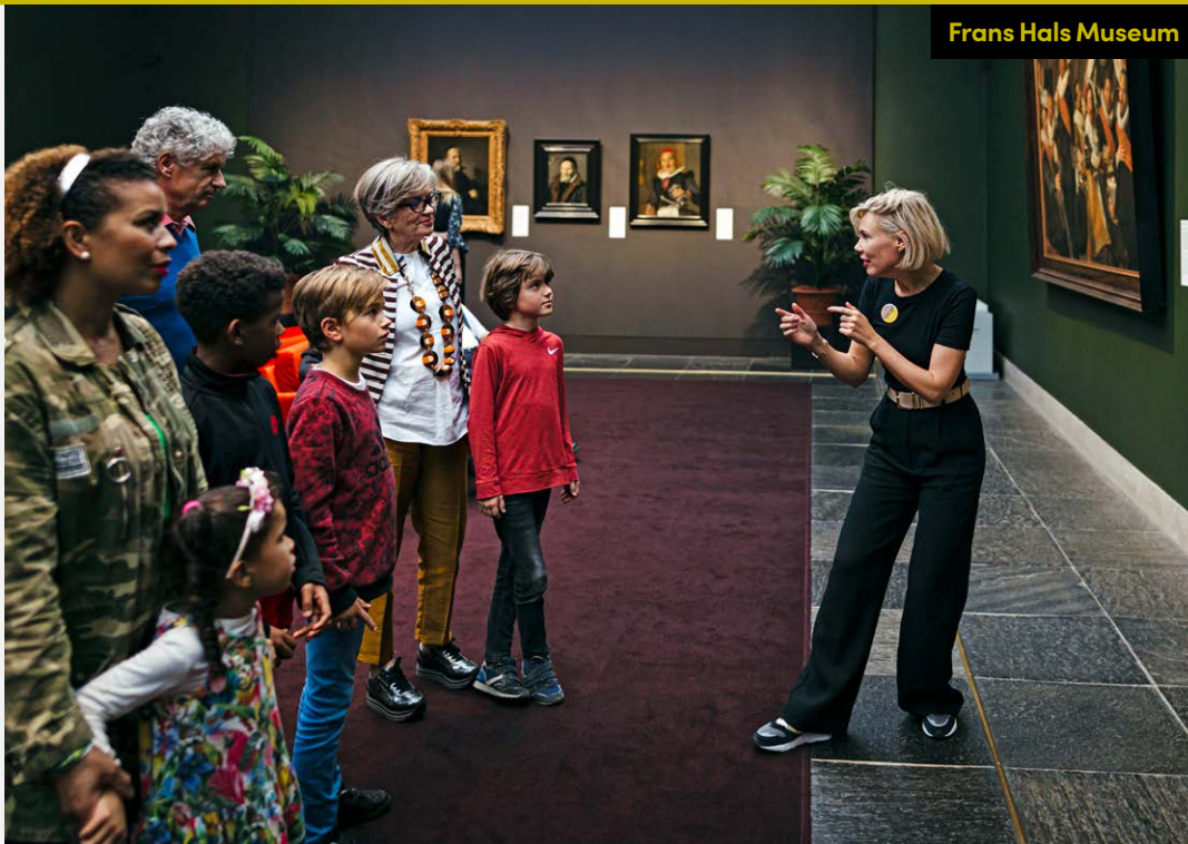
Frans Hals Museum