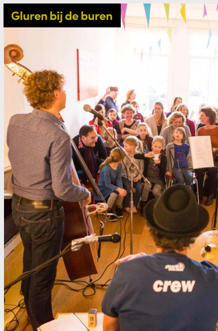
Gluren bij de burens

realiseren. Het betreft een gezamenlijke impuls op het versterken van cultuur in Haarlem, die in onderlinge afstemming ontwikkeld moet worden. Dat vraagt tijd en ruimte. Als in een groeimodel brengen we kansen en mogelijkheden in kaart, versterken we ons netwerk, bouwen we voort op wat we al doen, ontwikkelen we nieuwe plannen, en gaan we aan de slag. De beschikbare capaciteit bij culturele makers en instellingen én de gemeente kent ook grenzen. Het Cultuurplan is ambitieus, de gemeente heeft hier slechts 5 fte voor beschikbaar. Jaarlijks stellen we prioriteiten en sturen we bij waar nodig, ook wat betreft de ambtelijke inzet. Aan de hand van de volgende agenda werken gemeente en culturele makers en instellingen gezamenlijk aan het realiseren van de visie en ambities voor onze prachtige cultuurstad: