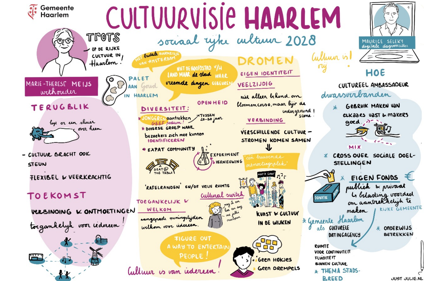
Figuur 1. Getekend verslag van stadsgesprek (16-12-2020)

inspirerende cultuureducatie-projecten. Tegelijkertijd constateerden veel partijen dat men geen weet heeft van elkaars activiteiten. Het verbinden van al die initiatieven, instellingen en cultuurmakers vormt de grote uitdaging voor de komende jaren, oftewel een eenheid vormen van de archipel aan losse eilandjes, die Haarlem nu nog teveel is. Zodat we de